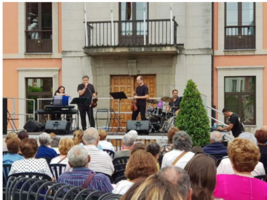
Barrocko Project frente al Ayuntamiento noreñense.